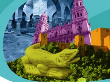
Tabla de precios